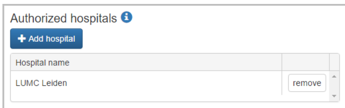
Figuur 6 ziekenhuizen autoriseren

Door de knop Add hospital aan te klikken kunt u het gewenste ziekenhuis selecteren en toevoegen aan de lijst van ziekenhuizen met wie u dit dossier wilt delen. Het toegevoegde ziekenhuis krijgt hiermee toestemming en is bevoegd om het patiëntendossier op te zoeken in de database en procedures toe te voegen.