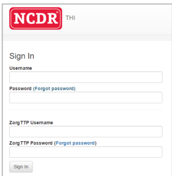
Figuur 1 inlogscherm applicatie

De gebruiker logt in met de username en het password dat van de NCDR is verkregen en met de ZorgTTP username en password als men persoonsgegevens wil kunnen invoeren en opslaan of zichtbaar wil maken door middel van decryptie.